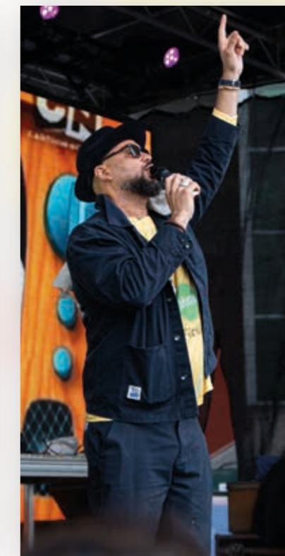
Kaliffa på Finalfestivalens scen