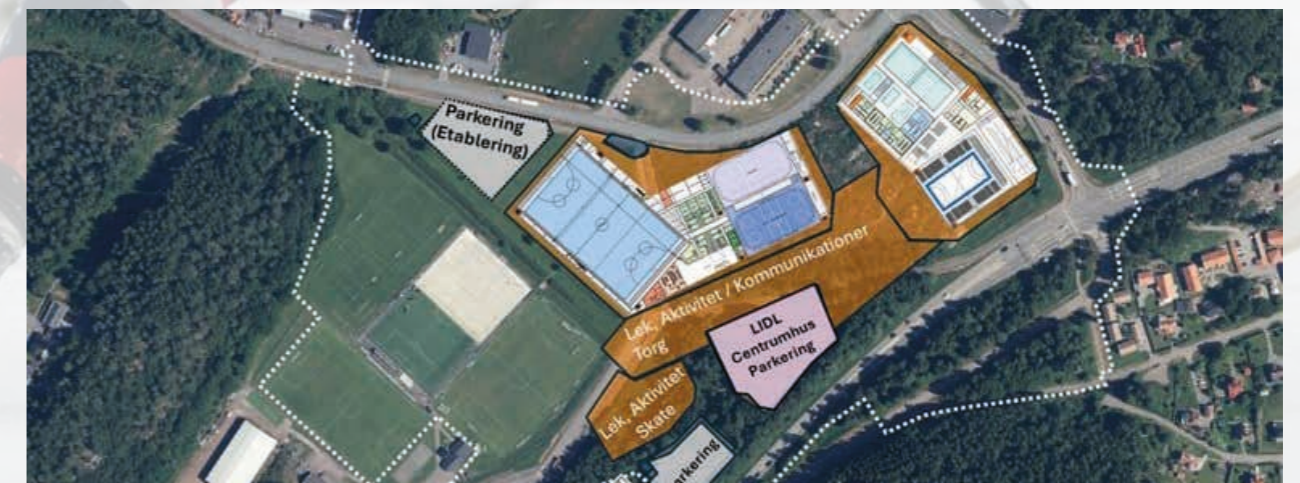
Kungälv arena blir ett centrum för idrott, kultur och evenemang.

Framåt ser Anläggningskommittén ett behov av fortsatt samverkan inom förbundet, särskilt kopplat till utvecklingen av barn- och ungdomsverksamheten, då denna utgör en central del i argumentationen för framtida anläggningsinvesteringar. Vidare prioriteras fortsatt kunskapsdelning, faktainsamling och utveckling av stödmaterial för att stärka föreningars och kommuners beslutsunderlag.