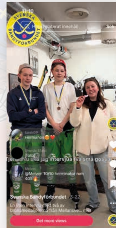
Skärmdokument från TikTok 2026

Samverkan mellan kommunikation och marknad har varit en nyckelfaktor under året. Kommunikationsinsatserna har haft en central roll i att synliggöra och aktivera partnerskap, samtidigt som marknadsarbetet har skapat förutsättningar för ökad synlighet och utvecklade erbjudanden. Sammantaget har verksamhetsåret inneburit en tydlig förflyttning mot en mer samlad, målgruppsdriven och marknadsorienterad helhet, där kommunikation och marknad i högre grad samverkar för att skapa värde för svensk bandy.